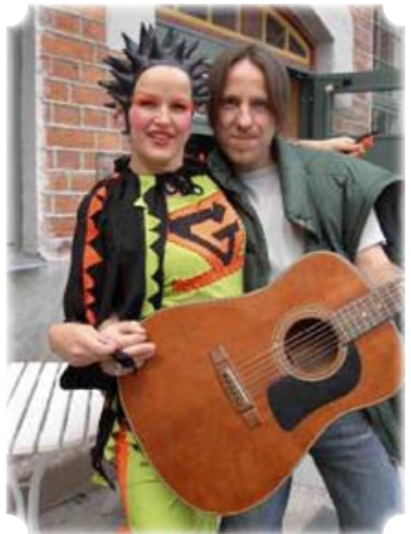
Två figurer från Gazbazz, som underhöll med teatersport